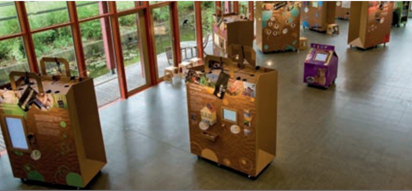
Ganz alltäglich: Beim Einkauf landen unzählige Produkte in Taschen und Tüten. Die Ausstellung verweist mit 7 übergroßen Tüten auf das Thema.

In 8 Bereichen mit 16 interaktiven Elementen lädt die Wanderausstellung »KonsumKompass« Besucherinnen und Besucher ein, den täglichen Konsum – vom Blatt Papier bis zur Urlaubsreise – genauer unter die Lupe zu nehmen. Diese achte von inzwischen neun Wanderausstellungen der Deutschen Bundesstiftung Umwelt (DBU) zeigt die Möglichkeiten und Chancen eines nachhaltigen Konsums und zukunftsfähiger Lebensstile. Die DBU und das Umweltbundesamt (UBA) entwickelten diese Ausstellung gemeinsam mit der Agentur signatur – wissen erleben aus Göttingen. Sie war bis Ende 2014 in Osnabrück im DBU Zentrum für Umweltkommunikation zu sehen und ist seitdem für fünf Jahre auf Wanderschaft durch ganz Deutschland.