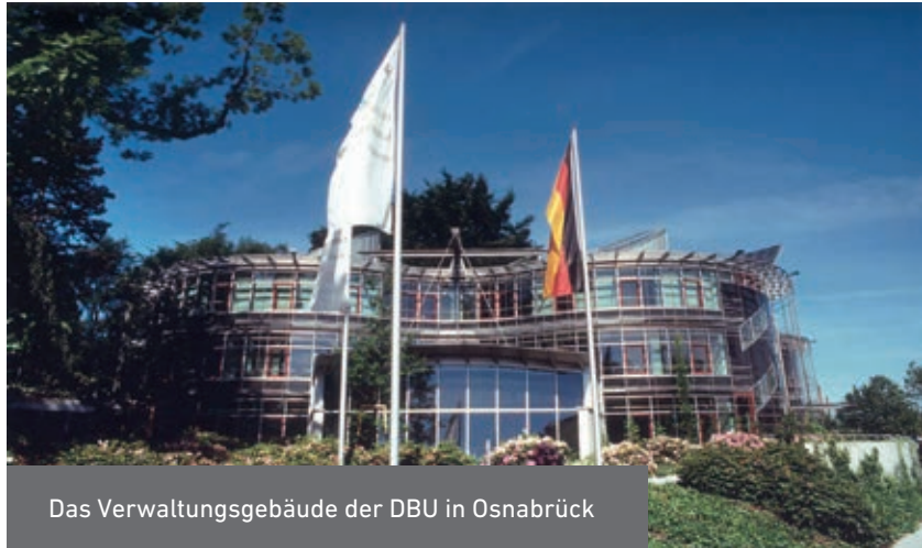
Das Verwaltungsgebäude der DBU in Osnabrück

Aktuelle Informationen über Förderschwerpunkte und weitere Aktivitäten können über das Internet unter www.dbu.de abgerufen werden.