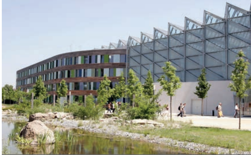
Das Hauptgebäude des Umweltbundesamtes in Dessau-Roßlau

Heute die Umweltprobleme von morgen identifizieren. Das Umweltbundesamt versteht sich auch als Frühwarnsystem, das mögliche zukünftige Beeinträchtigungen des Menschen und seiner Umwelt rechtzeitig erkennt, bewertet und praktikable Lösungen vorschlägt. Dazu forschen die Fachleute des Amtes in eigenen Laboren und vergeben