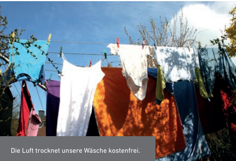
Die Luft trocknet unsere Wäsche kostenfrei.