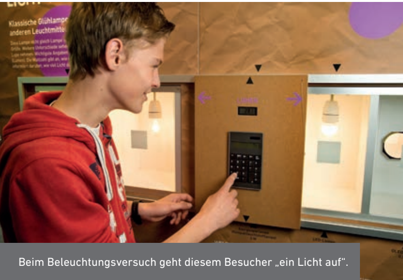
Beim Beleuchtungsversuch geht diesem Besucher „ein Licht auf“.